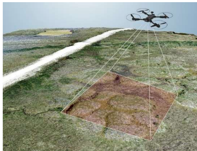
Drohnenaufnahmen in Churchill (Manitoba, Kanada) (Graphik: Christian Thiel (DLR), Luftbildaufnahmen Soraya Kaiser (AWI))